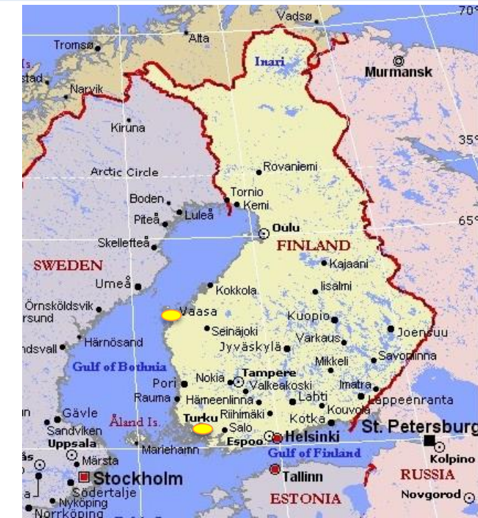
Turku Finland Map - Bing images