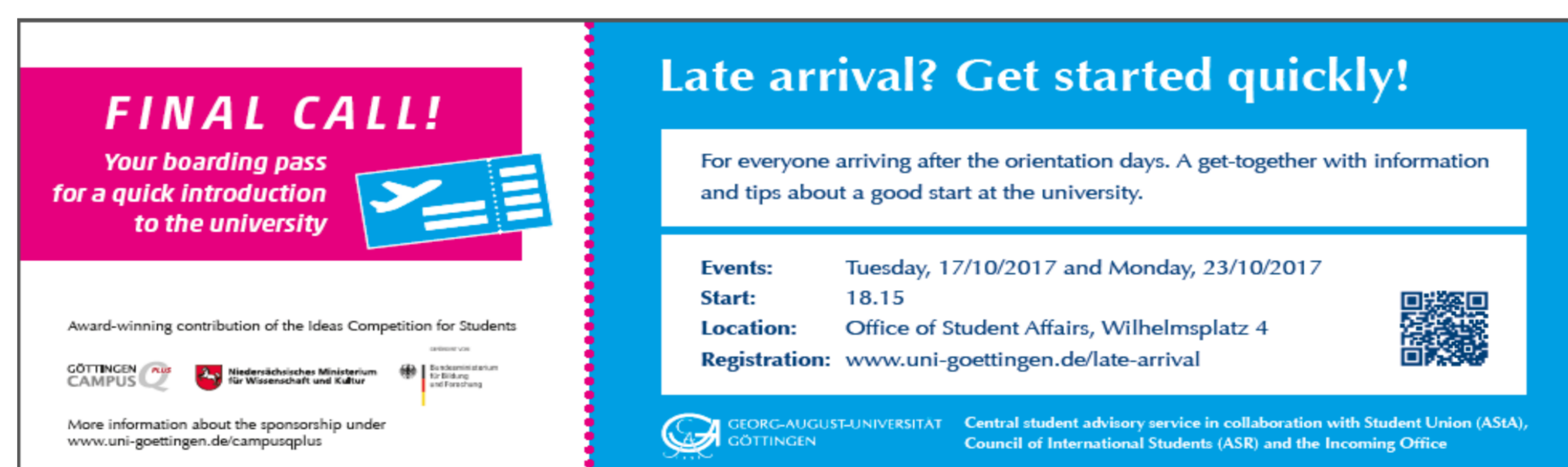
Angebote für Späteinsteiger_innen. Gemeinsam für Bildungsinländer_innen und Internationale