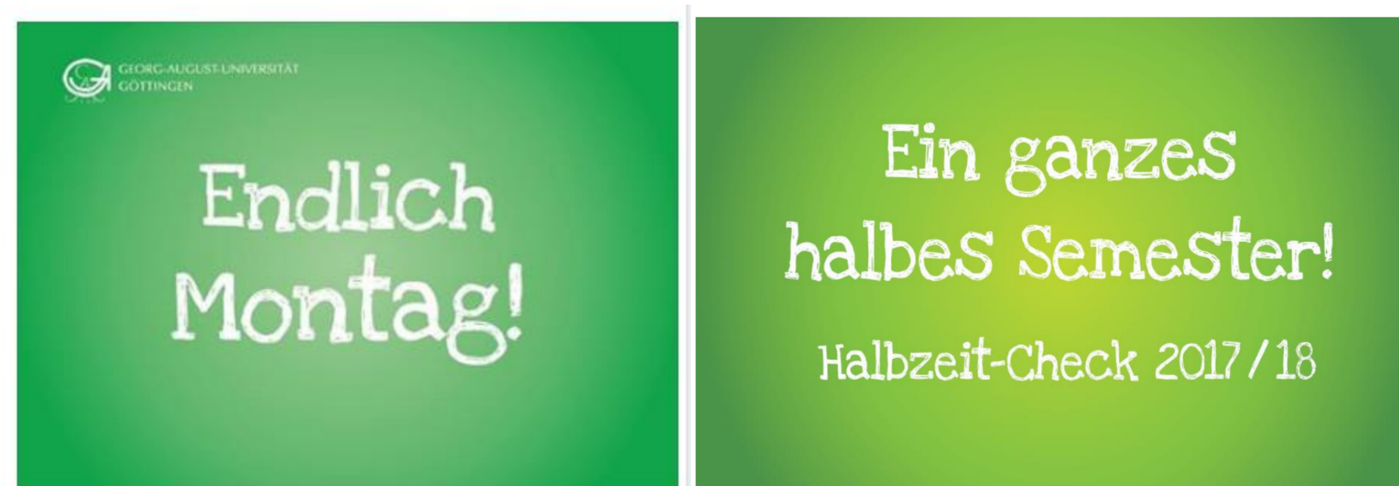
Fächerübergreifende Veranstaltungsreihen im ersten Studienjahr zur ersten Bestandsaufnahme im Studium und Neuorientierung