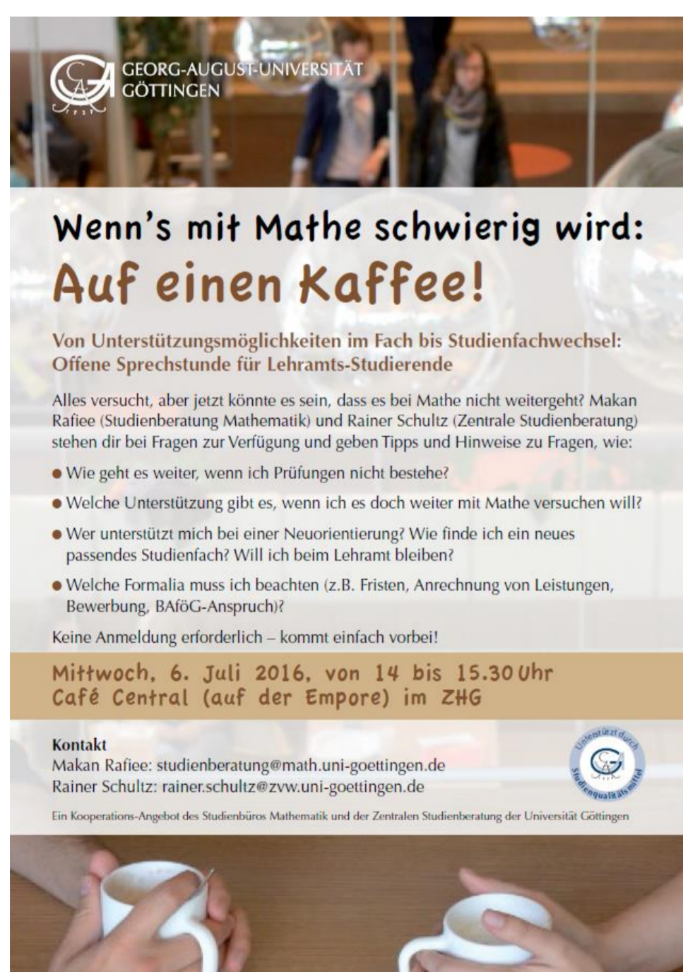
Fakultätsspezifische Angebote, z.B. bei ersten Zweifeln im Studium