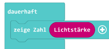
Beispiel 3: Programm zur Ausgabe der Werte des Lichtsensors

Bei den Tasten werden nur zwei Zustände bzw. Werte unterschieden: gedrückt (wahr) oder nicht gedrückt (falsch) . Der Lichtsensor unterscheidet hingegen mehrere Helligkeitsstufen. Während wir Begriffe wie hell, sehr hell oder dunkel verwenden, drückt der Sensor die Helligkeit in Zahlen aus. Um mit dem Sensor arbeiten zu können, müssen wir also zunächst ein Gefühl dafür entwickeln, welche Bedeutung die Zahlen haben, die der Sensor liefert. Welche Zahlen würden wir dem Begriff hell und welche dem Begriff dunkel zuordnen? Es bietet sich daher an, zunächst ein kleines Programm wie in Beispiel 3 zu schreiben, das die Werte des Sensors kontinuierlich auf dem LED-Display ausgibt. Die Werte des Sensors liefert der Block Lichtstärke im Bereich Eingaben .