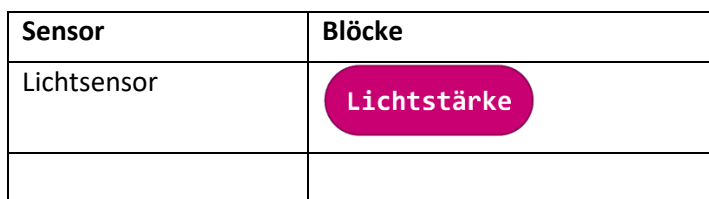
Abbildung 3: Tabelle für eine Übersicht der Sensoren des Calliope

Aufgabe 6: Erkunde welche Sensoren der Calliope noch besitzt, welche Blöcke im Bereich Eingaben dazu jeweils zur Verfügung stehen und welche Werte die Sensoren liefern. Lege eine Tabelle wie in Abbildung 3 an und vervollständige sie.