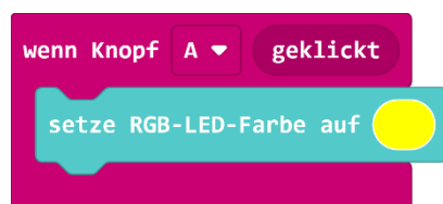
Beispiel 1: Verwenden des "Wenn Knopf geklickt" - Blocks

In den linken Block können wir weitere Blöcke einfügen, die ausgeführt werden sollen, wenn der Anwender die entsprechende Taste drückt. Dieser Teil des Programms startet also nicht sofort, sondern erst wenn das Ereignis eintritt, dass die entsprechende Taste gedrückt wird (s. Beispiel 1). Der rechte Block liefert uns den Wert wahr oder falsch, je nachdem, ob die entsprechende Taste gerade gedrückt wird oder nicht. Diesen Wert können wir in unserem Programm abfragen und auswerten (s. Beispiel 2).